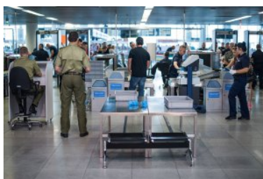
Funkcjonariusz Straży Granicznej prowadzi nadzór nad kontrolą bezpieczeństwa.