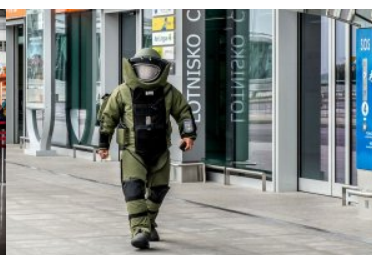
Pirotechnik w kombinezonie.