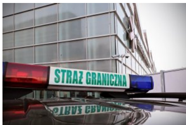
Widoczny kogut na dachu samochodu służbowego Straży Granicznej. W tle terminal Lotniska Chopina.