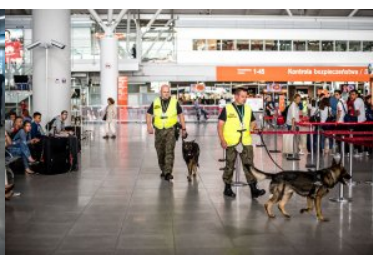
Przewodnicy z psami służbowymi patrolują halę terminala lotniska.