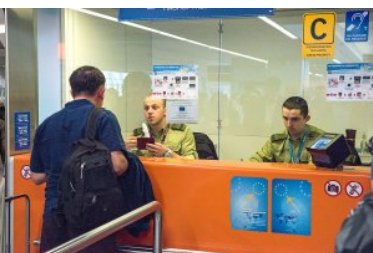
Funkcjonariusze siedząc w kabinie sprawdzają dokumenty.