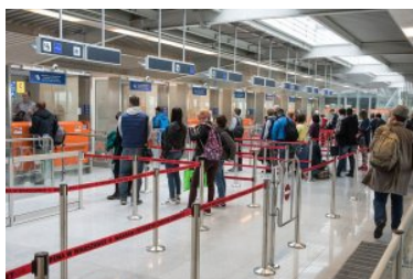
Podróżni stoją przed kabinami kontroli granicznej.