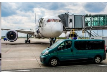
Na płycie lotniska stoi samolot i samochód Straży Granicznej.