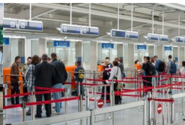
Podróżni stoją przed kabinami kontroli granicznej.