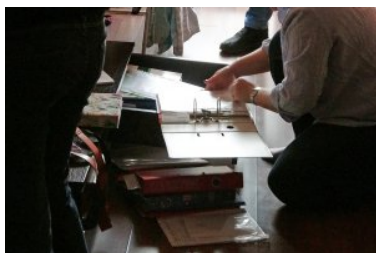
Segregator z dokumentami