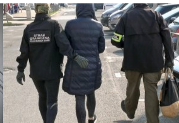
Funkcjonariusze SG prowadzą zatrzymaną do samochodu