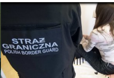
Na pierwszym planie Funkcjonariusz SG, w tle zatrzymana