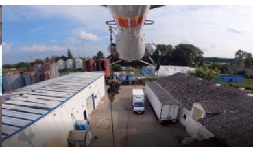
Funkcjonariusze SG desantują się ze śmigłowca.