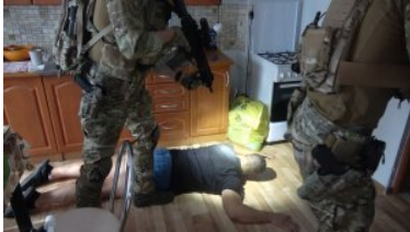
Funkcjonariusz grupy realizacji pilnuje zatrzymanego.