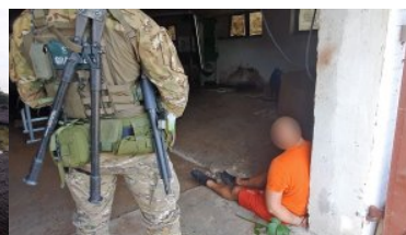
Funkcjonariusz grupy realizacji pilnuje zatrzymanego.