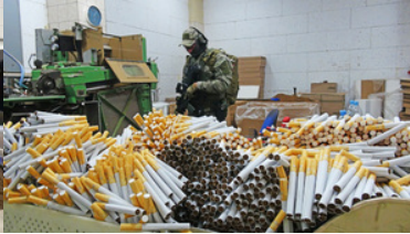
Papierosy leżące luzem na maszynie, w tle funkcjonariusz SG.