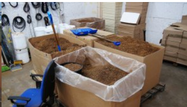
Kartony z nielegalnym tytoniem.