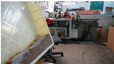
Papierosy ułożone w plastikowym pudełku, w tle maszyna pakująca.