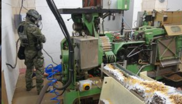
Funkcjonariusz grupy realizacji pilnuje zatrzymanego.