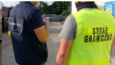
Funkcjonariusze Europolu i Straży Granicznej stojący tyłem.