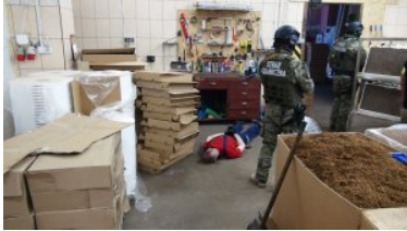
Funkcjonariusz grupy realizacji pilnuje zatrzymanego.