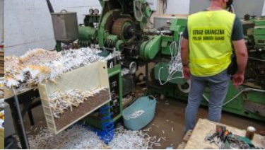
Funkcjonariusz SG stoi przy maszynie produkującej papierosy.