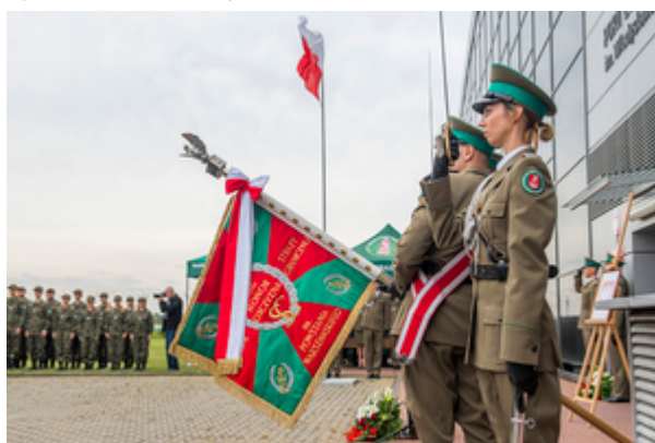
Poczet Sztandarowy Nadwiślańskiego Oddziału Straży Granicznej im. Powstania Warszawskiego