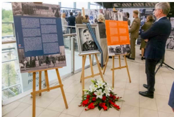
Uczestnicy uroczystości zwiedzający wystawę przygotowaną ku czci gen. bryg. Józefa Adama Pecki