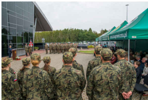
Widok z tyłu na uczniów szkoły patronackiej z Łodzi w tle podział funkcjonariuszy kadry kierowniczej i PSG w Łodzi