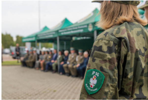
Zbliżenie na rękaw z emblematem patronackiej szkoły NwOSG