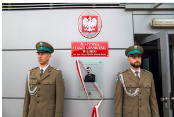
Asysta funkcjonariuszy Placówki Straży Granicznej w Łodzi przy pamiątkowej tablicy ku czci gen. bryg. Józefa Adama Pecki