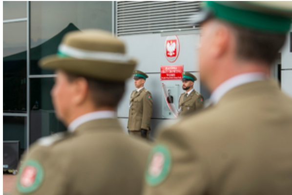
Na pierwszym planie funkcjonariusze stojący tyłem w tle asysta przy tablicy pamiątkowej Patrona PSG w Łodzi