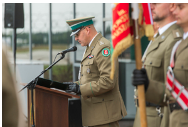
ppłk SG Rafał Grzejszczak Komendant PSG w Łodzi podczas wystąpienia