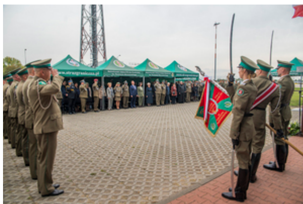
Na pierwszym planie funkcjonariusze Straży Granicznej oraz Poczet Sztandarowy NwOSG w tle zaproszeni goście podczas odegrania Hymnu Państwowego