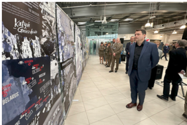
Uczestnicy uroczystości oglądają wystawę.