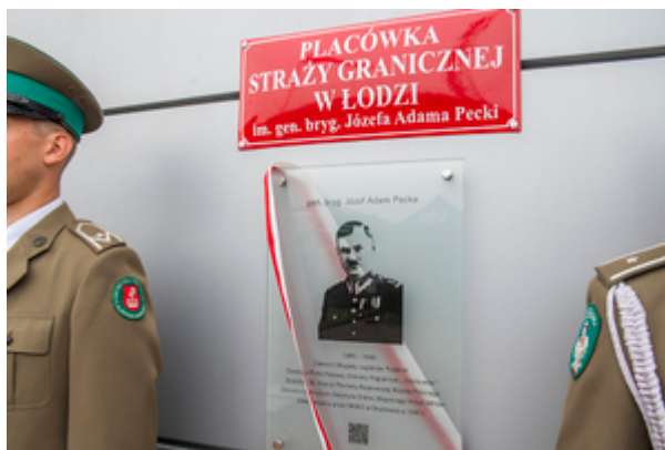
Zbliżenie na tablicę pamiątkową z wizerunkiem gen. bryg. Józefa Adama Pecki