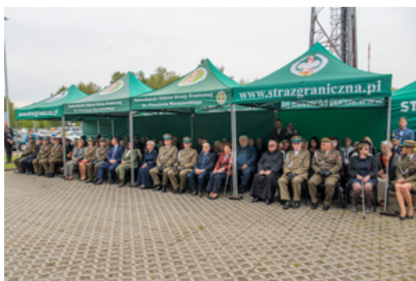
Komendant NwOSG wraz z Komendantem PSG w Łodzi wśród zaproszonych gości