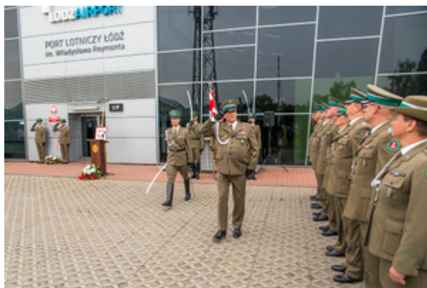
Komendant Nadwiślańskiego Oddziału Straży Granicznej płk SG Dariusz Lutyński podczas powitania pododdziałów