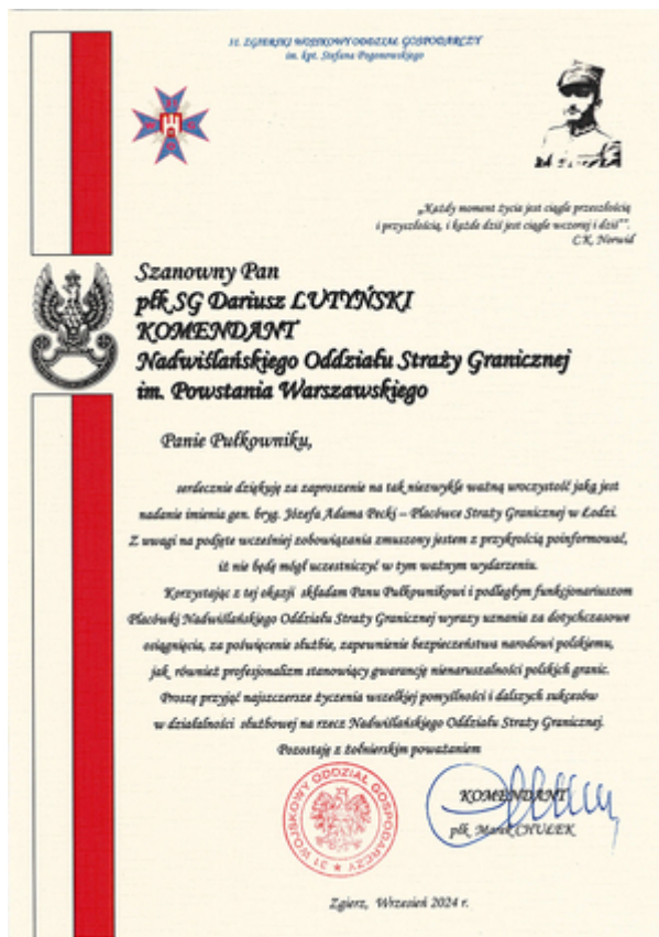
31. Zgierski Wojskowy Oddział Gospodarczy.