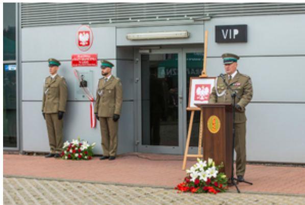
Komendant NwOSG płk SG Dariusz Lutyński podczas wystąpienia na tle asysty funkcjonariuszy przy tablicy pamiątkowej