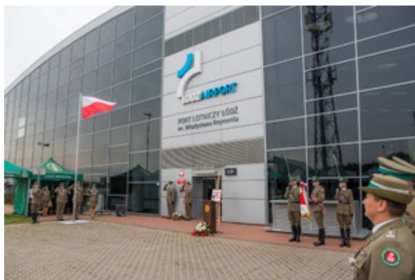
Ogólny widok na plac apelowy podczas odegrania Hymnu Państwowego