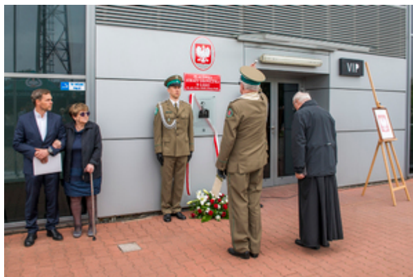
Kapelan NwOSG wraz z Kapelanem Stowarzyszenia "Rodzina Katyńska" podczas ceremonii poświęcenia tablicy pamiątkowej