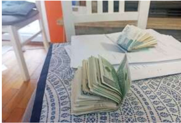
Uderzenie w zorganizowaną grupę przestępczą.