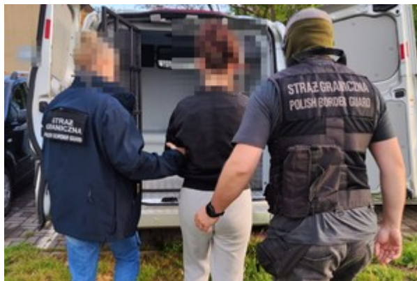
Uderzenie w zorganizowaną grupę przestępczą.