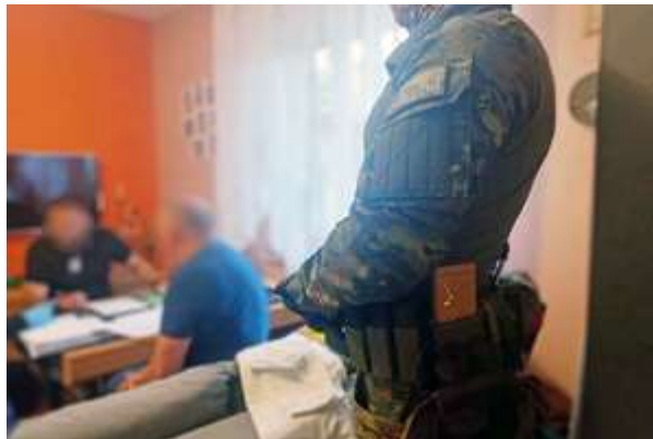
Uderzenie w zorganizowaną grupę przestępczą.