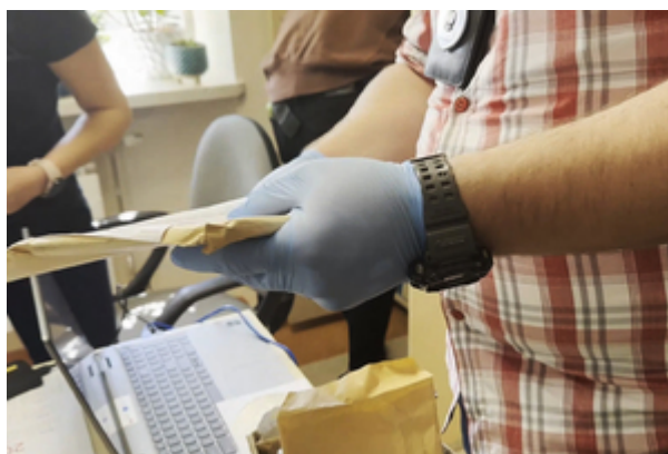
Uderzenie w zorganizowaną grupę przestępczą.

Łącznie w działania zaangażowanych było ponad 120 funkcjonariuszy SG z Nadwiślańskiego i Bieszczadzkiego Oddziału SG oraz Komendy Głównej SG.