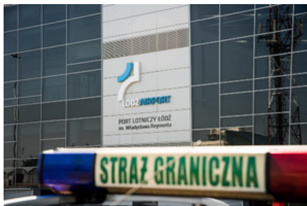
Widoczny kogut na dachu samochodu służbowego Straży Granicznej. W tle terminal Lotniska w Łodzi.