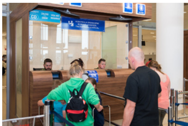
Funkcjonariusze siedząc w kabinie sprawdzają dokumenty.