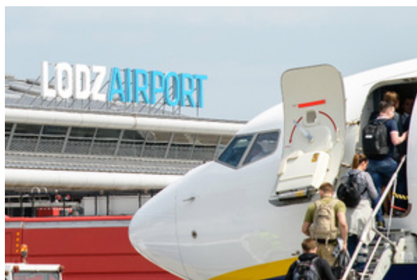
Pasażerowie wchodzą do samolotu. W tle napis na budynku terminala Lodz Airport.