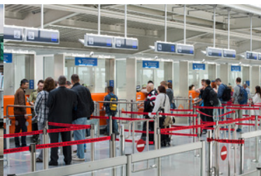
Podróżni stoją przed kabinami kontroli granicznej.