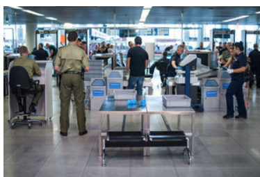
Funkcjonariusz Straży Granicznej prowadzi nadzór nad kontrolą bezpieczeństwa.