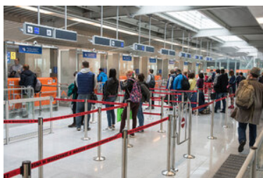
Podróżni stoją przed kabinami kontroli granicznej.