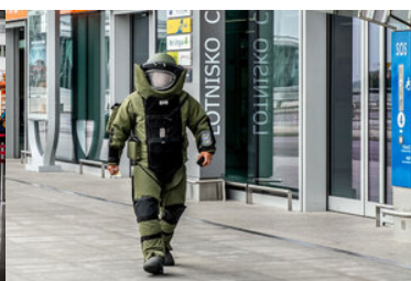
Pirotechnik w kombinezonie.