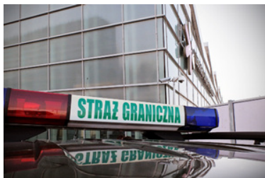
Widoczny kogut na dachu samochodu służbowego Straży Granicznej. W tle terminal Lotniska Chopina.