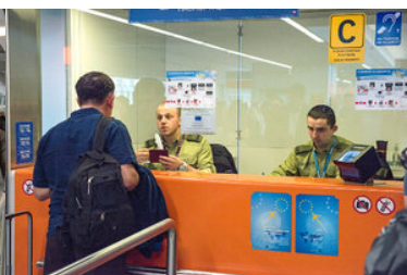
Funkcjonariusze siedząc w kabinie sprawdzają dokumenty.