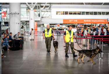
Przewodnicy z psami służbowymi patrolują halę terminala lotniska.